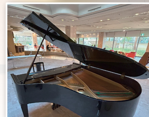
※ kokoka 交流ピアノ ロビーに設置していますのでお気軽にご利用ください。 曜日: 水・木・金 (祝日を除く) 時間: 12:00 ~ 13:00 / 17:00 ~ 18:00